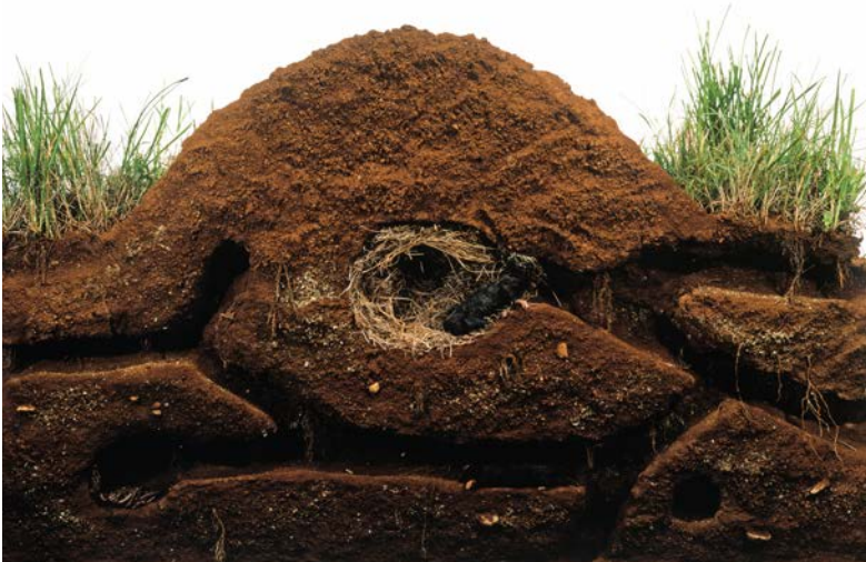
Vue de côté d'un nid de taupe et de tunnels