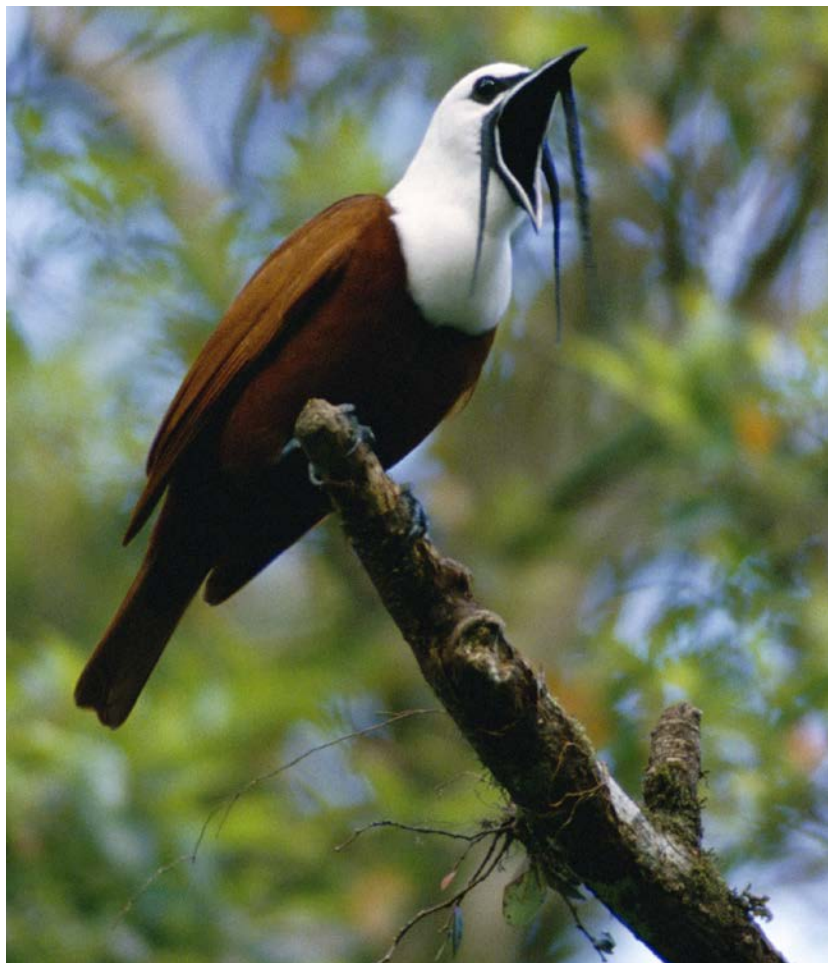
L'aracanga tricarunculé fait un bruit étrange.