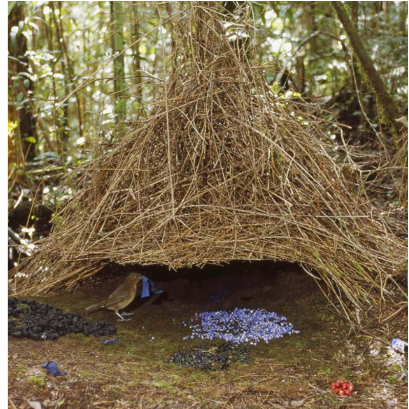
Un oiseau à bosquet mâle place des objets colorés dans sa maison.